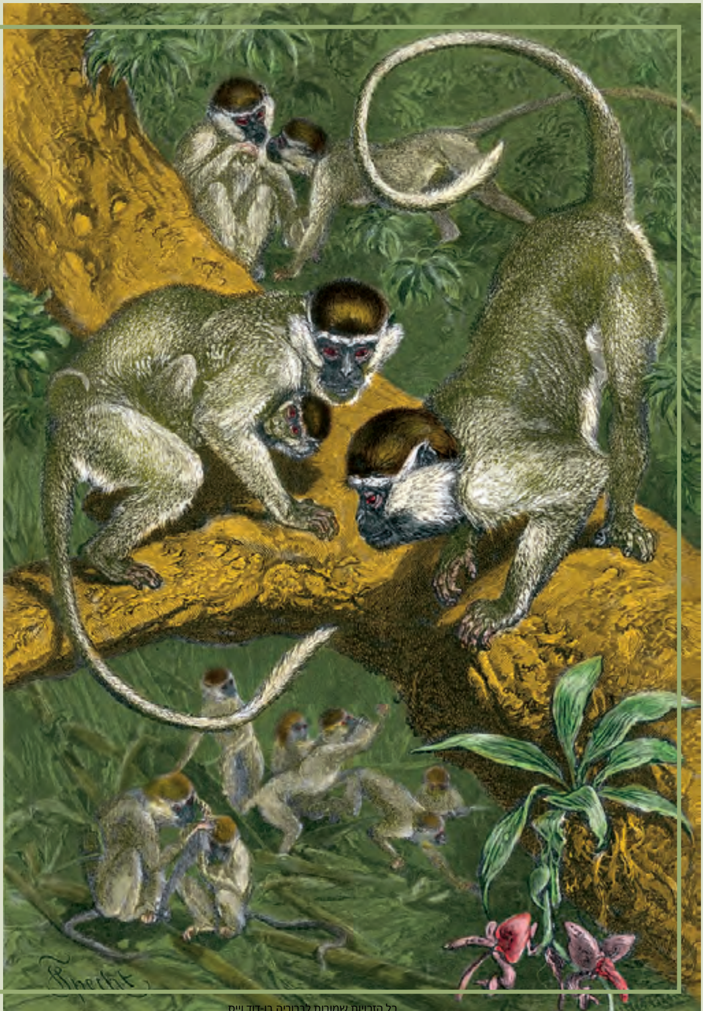
כל הזכויות שמורות לבורסה בן-דוד ויס