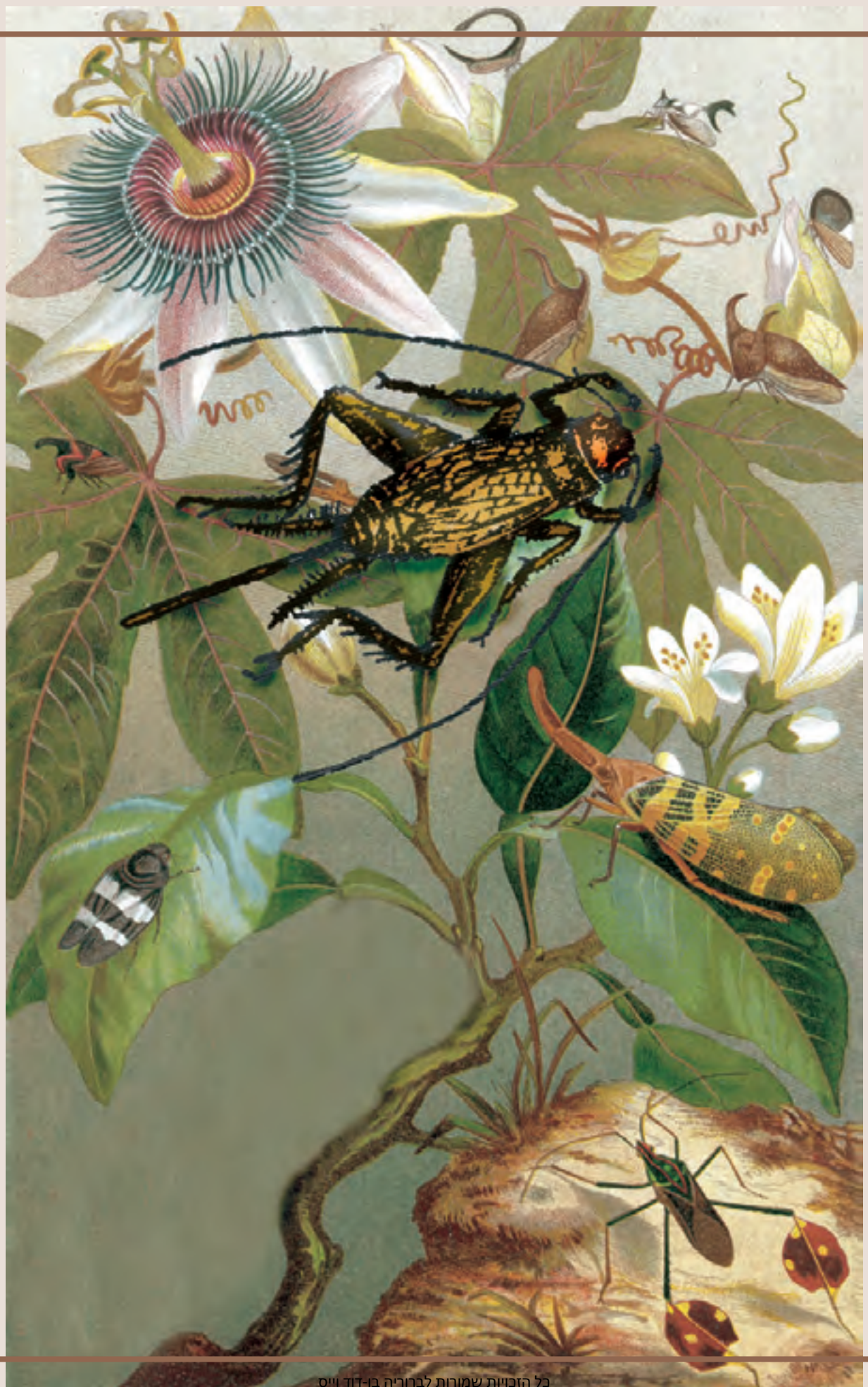
כל הזכויות שמורות לברוריה בן-דוד ויס